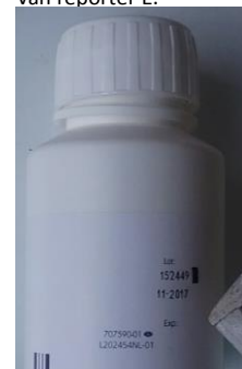
Figuur 2: foto afkomstig van reporter H.